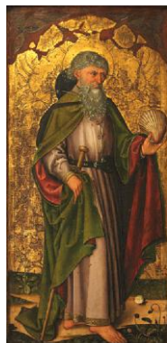
św. Jakub Starszy